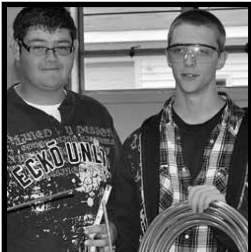
CALEFACCIÓN/VENTILACIÓN/ AIRE ACONDICIONADO

Los alumnos de Construcción de Electricidad a menudo va a utilizar sus habilidades para ser una electricista con licencia y luego abrir sus propios negocios. Usted aprenderá el cableado y el servicio eléctrico, tanto para los propietarios de viviendas y la industria.