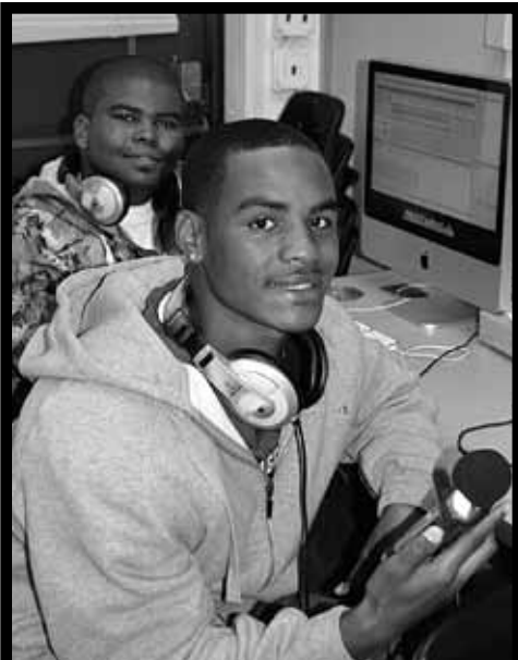
PRODUCCIÓN DE AUDIO

La Voz de Éxito. Aprenda a escribir y presentar sus escritos del radio mientras usted practica transmisión en el estudio profesional de Tech. O, registre su propia música con el equipo digital como lo hacen los profesionales.