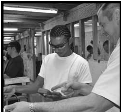
CONSTRUCCIÓN DE ELECTRICIDAD

Los alumnos de Construcción de Electricidad a menudo va a utilizar sus habilidades para ser una electricista con licencia y luego abrir sus propios negocios. Usted aprenderá el cableado y el servicio eléctrico, tanto para los propietarios de viviendas y la industria.