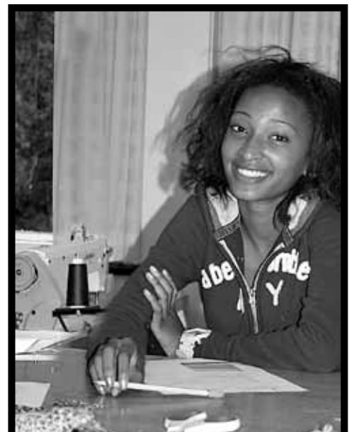
MERCADOLOGÍA DE MODA/DISEÑO

*Estos programas tienen pocos alumnos en cada clase.