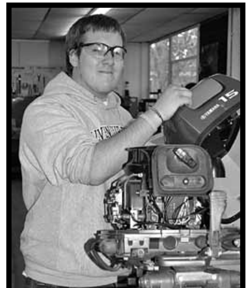
TECNOLOGÍA DE MOTORES MARINOS Y MOTORES DEL EQUIPO PARA LOS DEPORTES

*Estos programas tienen pocos alumnos en cada clase.