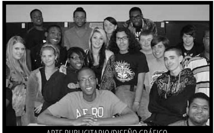
ARTE PUBLICITARIO/DISEÑO GRÁFICO

¿Tiene algunos preuntas sobre Wilson Tech? Llame a 667-6000, x300 o vea a su consejero(a).