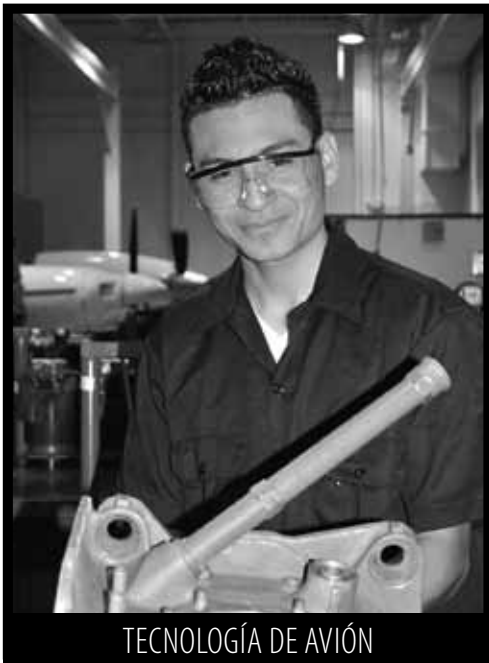
TECNOLOGÍA DE AVIÓN

Aprenda a reparar y reacondicionar los motores de ambos reciprocación y los motores de turbina en nuestras aulas en Republic Airport. Las líneas aéreas, los operadores privados del jet y las empresas eléctricas necesitan a técnicos bien entrenados de la tecnología.