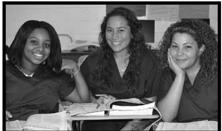
ASISTENTE DE ENFERMERA (CNA)

El curso de Arte Publicitario se ayuda a utilizar su creatividad en el acelerado mundo de la publicidad y las artes visuales. Crea un fantástico portafolio para la universidad o el ámbito de trabajo.