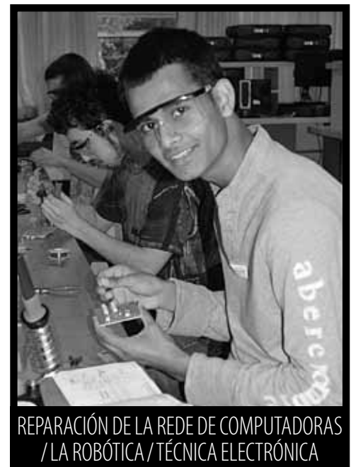
REPARACIÓN DE LA REDE DE COMPUTADORAS / LA ROBÓTICA / TÉCNICA ELECTRÓNICA

Encuentra una carrera que le encantará! Nunca se sabe lo que encontrará a abrazar o enfermero de nuevo a la salud en la clase de Asistente Veterinario! Entre las asignaciones de la anatomía y la biología, los estudiantes ayudan a cuidar a los gatos, conejos, hurones, iguanas, aves, tortugas y el perro de vez en cuando o una cabra. Ven y hacer nuevos amigos.