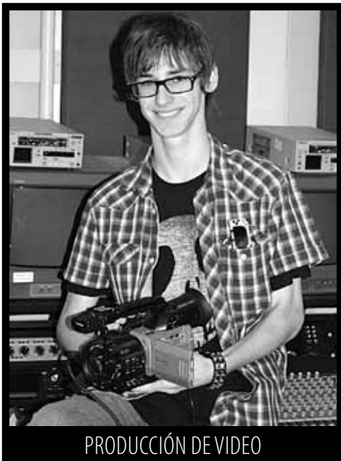
PRODUCCIÓN DE VIDEO

Aprenda a reparar y reacondicionar los motores de ambos reciprocación y los motores de turbina en nuestras aulas en Republic Airport. Las líneas aéreas, los operadores privados del jet y las empresas eléctricas necesitan a técnicos bien entrenados de la tecnología.